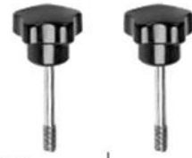
M5 torx head screw