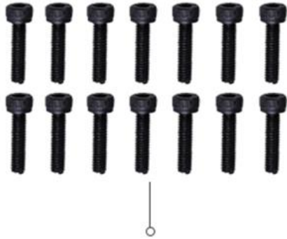
M4 Hexagon socket cylindrical head screw