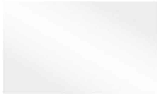
FEP Release film