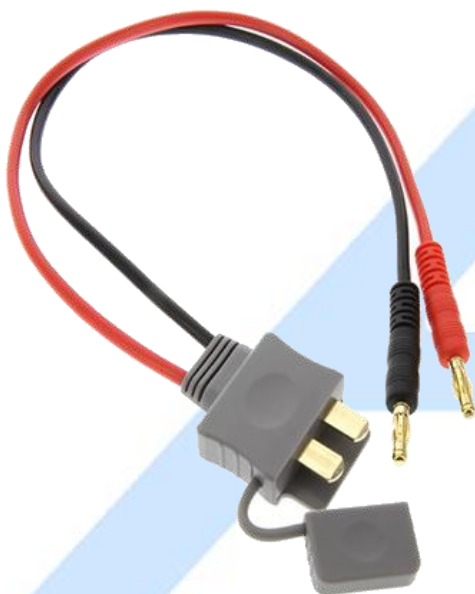
CABLE PARA BATERÍA PHANTOM 2/3

Cable de carga para batería de Phantom 2/3 compatible con cargador B6 / B6AC .