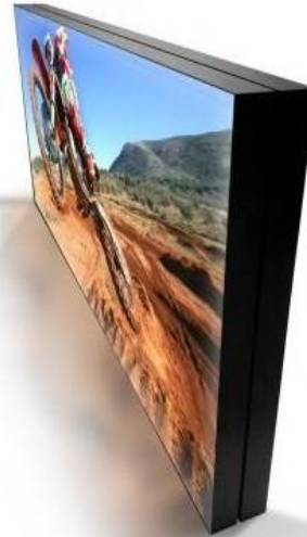
Cajas de luz backlight