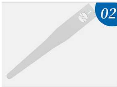
02 Cuchillo de palanca de CPU.