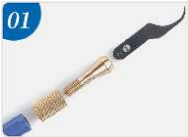
01 Doble sujeción en cruz para un agarre firme.