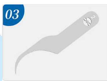
03 Cuchillo de pegamento.