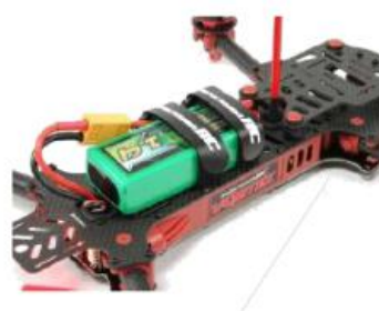
Drones, Avión controlado por RF