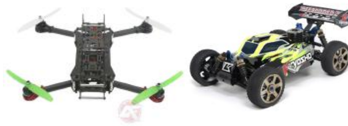
Drones, Avión controlado por RF