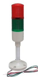
TORRETA-LED-12V/LB TORRETA SEMAFORO 12V CON BASE FIJA ALTA.