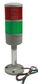
TORRETA-LED-ALARMA-12V/LB TORRETA SEMAFORO 12V C/ALARMA Y BASE FIJA ALTA.