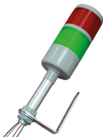
TORRETA-LED-ALARMA-12V/90 TORRETA SEMAFORO 12V CON BASE FIJA A 90 GRADOS.