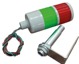
TORRETA-LED-127V/90 TORRETA SEMAFORO 127V CON BASE FIJA A 90 GRADOS.

| Conoce todos los modelos de torretas que tenemos a la venta.