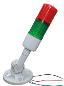
TORRETA-LED-ALARMA-12V TORRETA SEMAFORO 12V C/ALARMA Y BASE GIRATORIA.