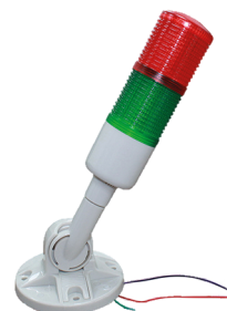
TORRETA-LED-12V/GR TORRETA TIPO SEMÁFORO DE LED 12V CON BASE GIRATORIA.