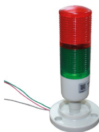
TORRETA-LED-12V TORRETA SEMAFORO 12V CON BASE FIJA.