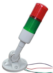
TORRETA-LED-ALARMA-12V TORRETA SEMAFORO 12V C/ALARMA Y BASE GIRATORIA.