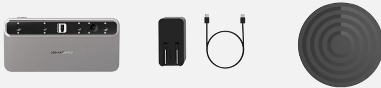
Escáner 3D Toucan × 1